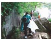
社員による五色沼遊歩道の清掃活動